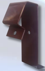
Kopėčių laikiklis universalus, koja