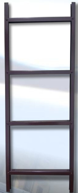
Kopėčios 1,25 m

Kopėčių atramos viena linija išdėstomas kas 1,0m-1,20m ir varžtais arba sraigtais tvirtinamos prie stogo konstrukcijų. Kai montuojama ant molio ar betono čerpių naudojami papildomi laikikliai, taip pat tenka sumontuoti papildomus grebėstus. Kiaurymės varžtams sandarinamos gumine tarpine, dedama tarp atraminės plokštelės ir stogo dangos, ir hermetikais.